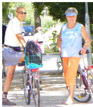
Kerékpározás, mint kedves időtöltés...

Egy ókori görög vázákép egy nekivetközött férfit ábrázol, aki egy hatalmas követ görget fölfelé egy hegy-csúcsra, kezével-lábával neki-rugaszkodva. A tagjai verejtékben áznak, a fejét por lepi. Kétoldalt az alvilág királyának és királynőjének ülő alakja látható. A Kr. e. 6. századból való alkotás az egyik görög monda azon jelenetét szemlélteti, ami szerint az alvilág leg-sötétebb mélységébe, a Tartaroszba került Sziszüphosz, amikor a kövével már-már eléri a csúcst, az hirtelen nagy lendülettel visszaesik. A hős pedig újra és újra nekilát hasztalan munkájának.